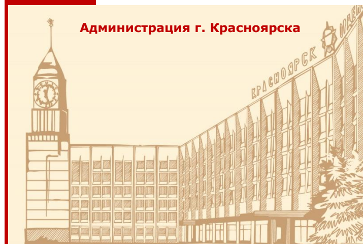
Администрация г. Красноярск

ВАЖНО! Заявление, поданное в электронной форме, обладает такой же юридической силой и влечет такие же юридические последствия, как и поданное при личном обращении